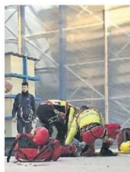
LAVORO Infortuni in aumento

► Nel 2025 le denunce all'Inail sono salite a quota 14mila ► Le imprese: «Prevenzione e formazione vanno incentivate, Rispetto all'anno prima cresciute pure le vittime da 16 a 19 anche un singolo errore può avere delle gravi conseguenze»