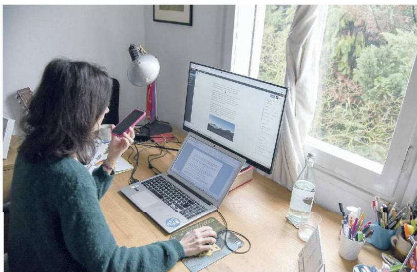
FLESSIBILITÀ Lo smart working ha avuto un'accelerazione durante la pandemia: ora serviranno accordi tra lavoratori e aziende

I dipendenti delle grandi imprese che lavorano da casa sono circa 26.300 (in lieve risalita), quelli delle piccole e medie imprese 14.800 (circa il 10% del totale della loro forza lavorativa, anche qui c'è un leggero incremento). Troviamo poi 14.900 lavoratori delle micro imprese (in flessione rispetto ai 17.100 radiografati un anno fa). Ne vanno poi aggiunti circa 2.300 della pubblica amministrazione (a loro volta in flessione).