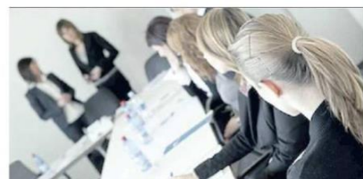
DONNE Il numero di imprese a guida femminile resta stabile

I settori a maggior presenza femminile, secondo i dati della Camera di Commercio, sono quelli del commercio (25%), dei servizi alla persona (20,7%) e dell'agricoltura (14,6%). Più consistente la componente femminile nelle libere professioni, che vedono le donne rappresentare il 30,5% degli iscritti agli ordini. In particolare, tra consulenti del lavoro e avvocati la quota femminile supera la metà del totale (52%). In totale, le donne professioniste tra gli Albi presi in considerazione dall'indagine sono 4.300.